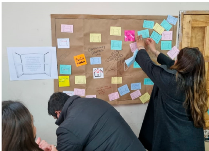
Actividad presencial, Tucumán, 2022

“Entre todo el trabajo como docentes que tenemos que hacer, quizás descuidamos algunas cosas y entonces los mensajitos de aliento, como ‘falta poco, sigan que estamos esperando sus actividades’ la verdad que estuvo muy bien porque los docentes que tenemos cargos muy absorbentes tenemos poco tiempo, y esos recordatorios, la verdad es que nos ayudaron mucho”. Preceptora, participante de la provincia de Salta.