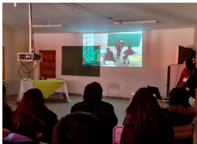
Actividad presencial, Tucumán, 2022

los temas o problemáticas que surgen son luego abordados en mayor profundidad en otros ámbitos escolares: