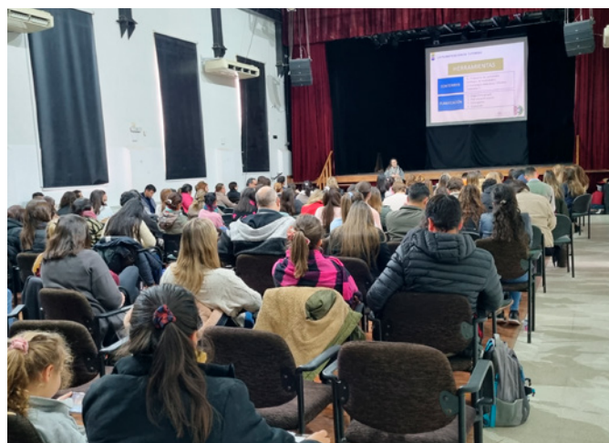
Encuentro presencial en Paraná, Entre Ríos, 2022.