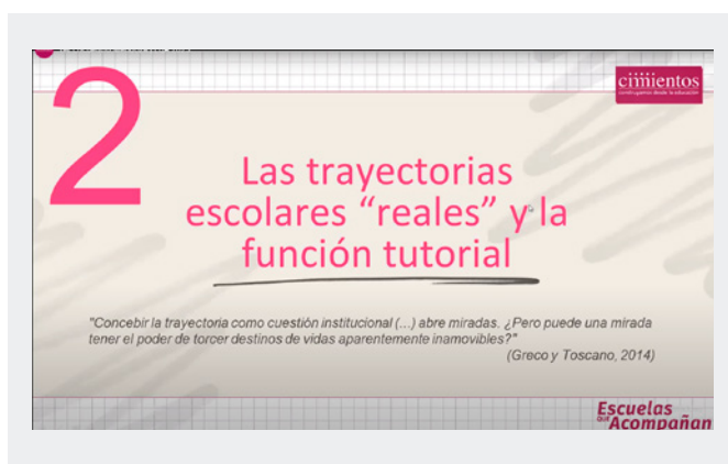
Encuentro virtual, Mendoza, 2023.

Módulo 4: Otros componentes clave y herramientas de acompañamiento. El eje se encuentra en el rol de las familias en el acompañamiento a las trayectorias y las situaciones de riesgo educativo y/o vulneración de derechos (promoción, protección y abordaje desde la perspectiva del acompañamiento).