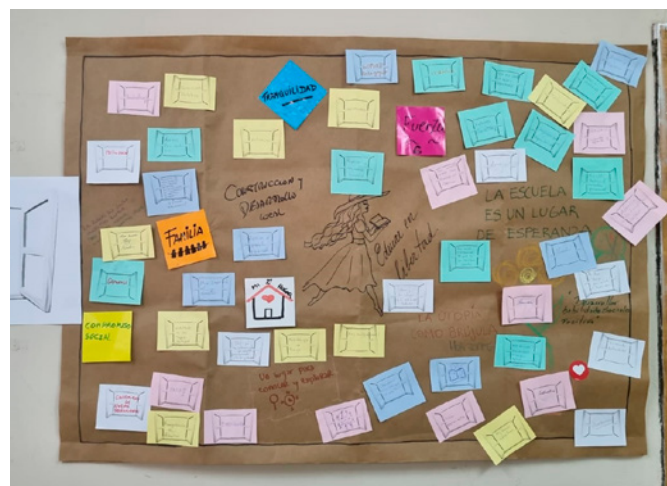
Actividad presencial, Tucumán, 2022

En segundo lugar, es destacable que muchos de los dispositivos diseñados ya se encontraban en curso en las instituciones antes de la formación. En este sentido, el “plus” que aporta el Programa es el encuadre, es decir, la incorporación de esos dispositivos aislados en un todo, en un proyecto unificado con foco en las habilidades socioemocionales. Otro punto para destacar es que, en la mayoría de los casos, se promueve que las propuestas diseñadas trasciendan a los participantes de la formación y que se involucre una mayor cantidad de docentes de la institución. Sin embargo, algunas entrevistadas mencionaron que no siempre es fácil lograr el compromiso del cuerpo docente; principalmente de aquellos que tienen mayor antigüedad en las instituciones y son reacios a introducir cambios en sus prácticas.