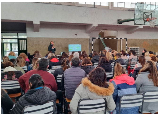
Encuentro presencial en Mendoza, 2023.

En las entrevistas realizadas se observó que, si bien las participantes estuvieron conformes con la diná-